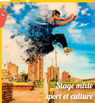
Stage mixte sport et culture

Stage Sports urbains et doublage de séries (10/14 ans)